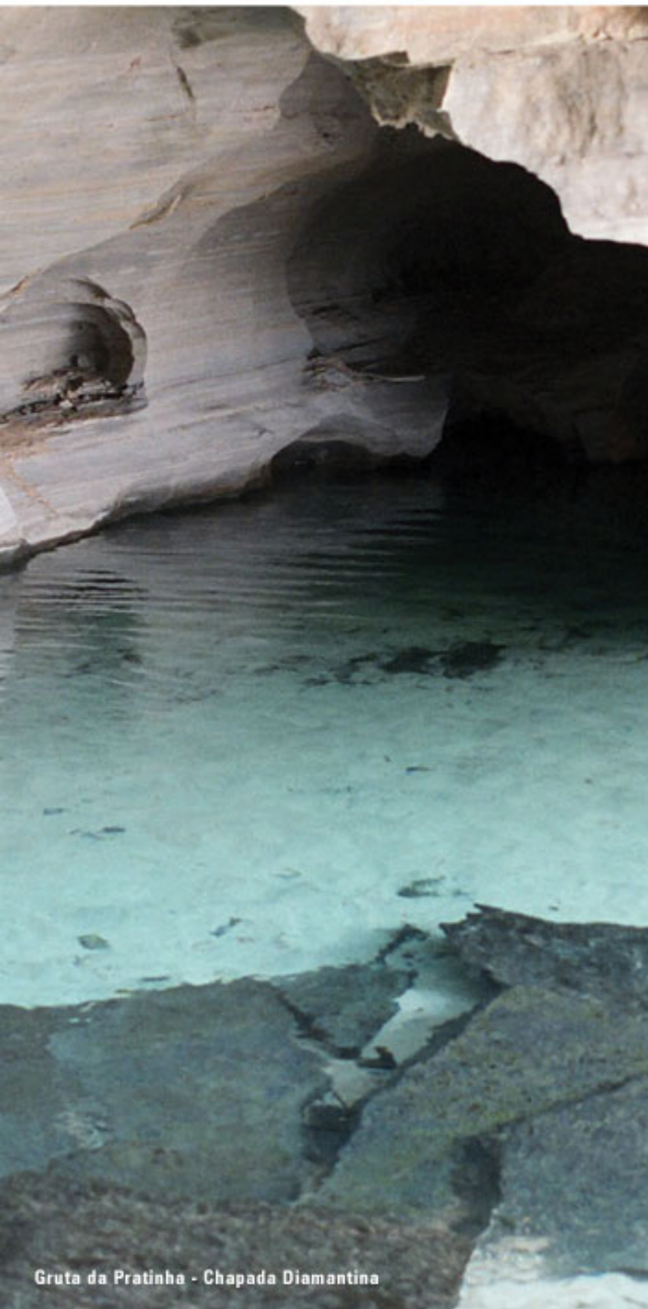
Gruta da Pratinha - Chapada Diamantina