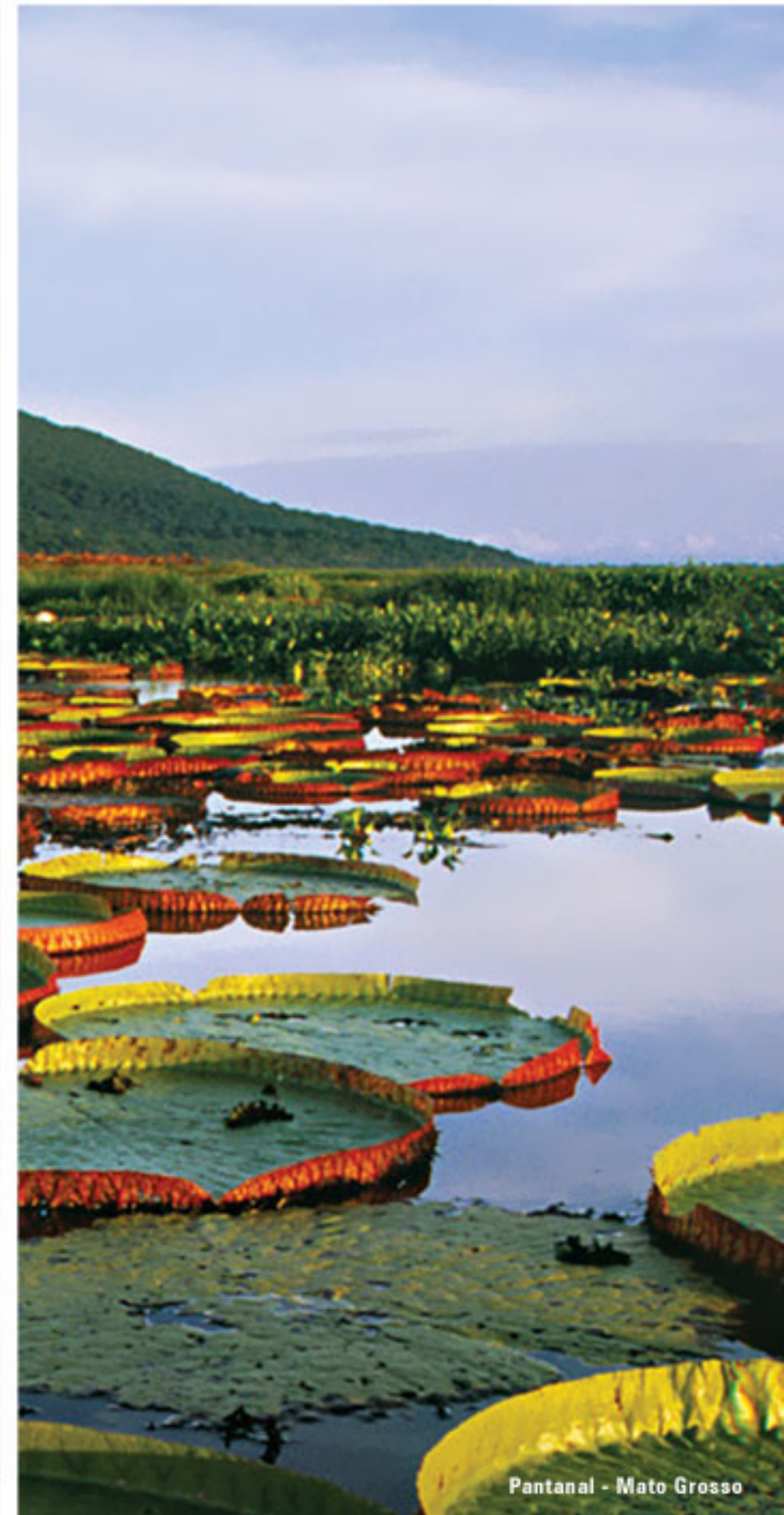
Pantanal - Mato Grosso